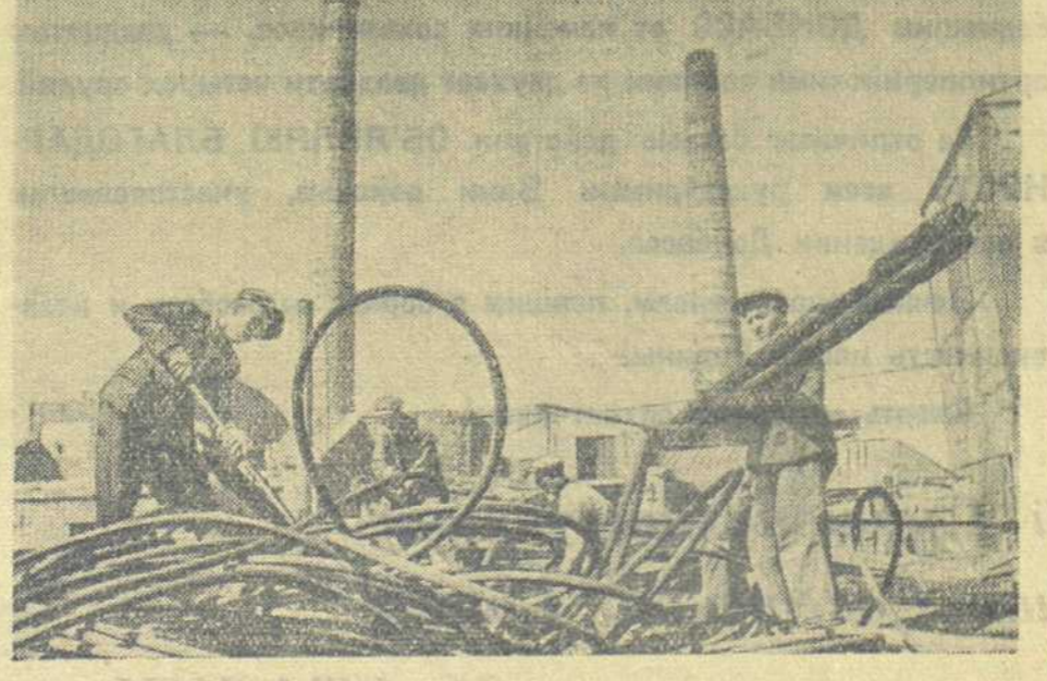
2. Горняки шахты «Кочегарка» очищают двор шахты от обломков взорванных и сожжённых зданий.